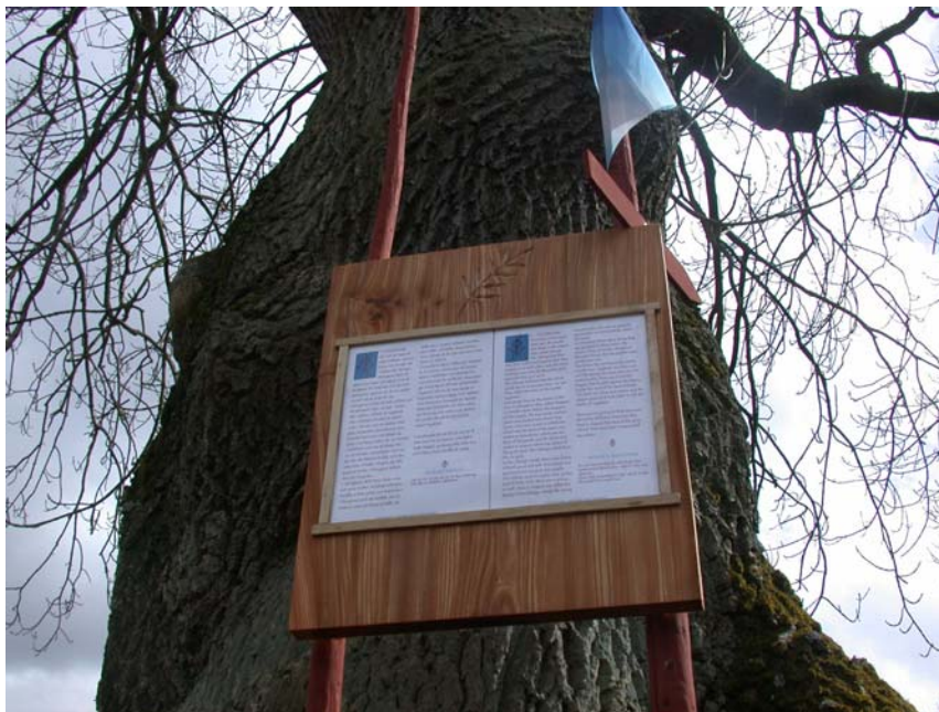
Karta över vandringen